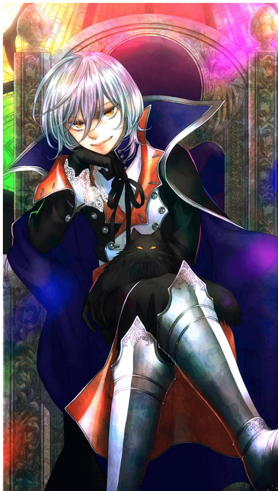
シド（CV.藤井美波、イラスト.Dite）