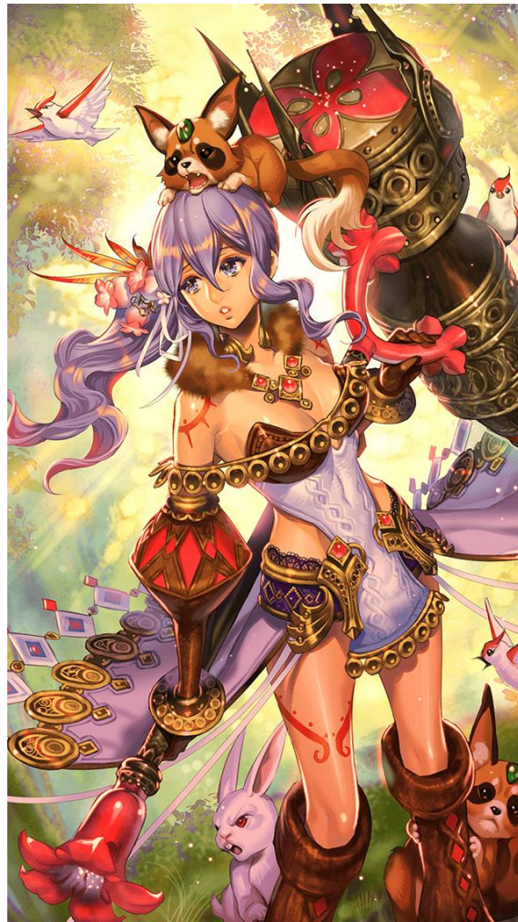
ロディタ（CV.田毎なつみ、イラスト.碧風羽）